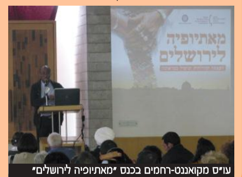
עו"ס מקואנט-רחמים בכנס 'מאתיופיה לירושלים'

"חשוב להרחיב את תכניות העצמת הקהילה האתיופית בהתמודדותה עם טראומות העלייה והקליטה" - דברי עו"ס