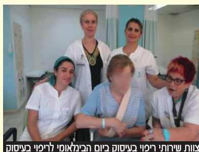
צוות שירותי רפוי בעיסוק ביום הבינלאומי לריפוי בעיסוק

ניתן היה לצפות בקבוצת הדרכה שדנה בגורמים לנפילות בבית ובדרכים למניעתן ובקבוצת אימון-