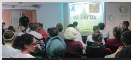
24.1.16. הדרכת חירום שנתי ללעובדי המרכז הרפואי הרצוג

עם סוגי שריפות. המשתתפים התנסו בתרגיל כיבוי אש.